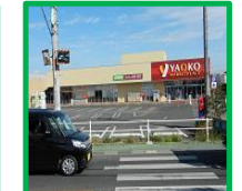
・ヤオコー入曽店前 (狭山入曽郵便局 バス停付近)

令和6年6月1日改定 医療法人尚寿会 法人事業本部 時刻表内の赤字は今回改定内容となっております。