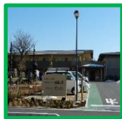
・福寿の里 (正面玄関付近)