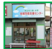
・包括支援センター前 (入曽駅東口より徒歩5分)