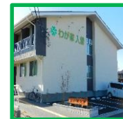
・わが家入曽 (入曽駅西口より徒歩1分)