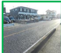
・狭山モータースクール前