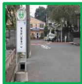
・3条通り (狭山団地中央バス停横)