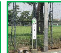
・狭山体育園 (野球場南バス停付近)