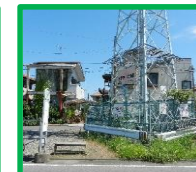
・佐久間工務所西 (本堀バス停付近)