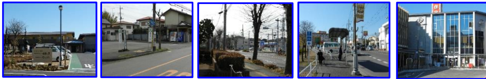
・福寿の里(正面玄関付近) ・西武フラワーヒルバス停付近 ・保健センター(けやき通り側) ・御狩場バス停付近 ・狭山市駅東口(第一プラザパチンコ付近)