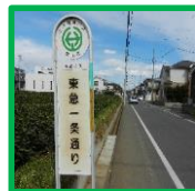
・1条通り (東急1条通りバス停付近)