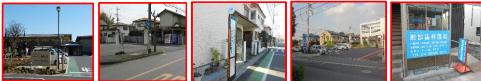
・福寿の里(正面玄関付近) ・西武フラワーヒルバス停付近 ・ネオポリス中央バス停付近 ・ラーク所沢 ・新所沢駅東口(刑部歯科医院付近)

令和6年6月1日改定 医療法人尚寿会 法人事業本部 時刻表内の赤字は今回改定内容となっております。